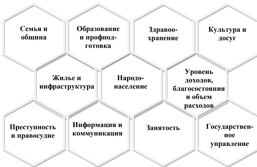
Области демографической и социальной статистики

7. Следует отметить, что этот набор также включает ряд возможных характеристик каждой статистической темы. Например, они касаются необходимости того, чтобы раздел статистики, посвященный актам рождения, был дезагрегирован с учетом возраста матерей, места проживания и пола ребенка. Этот элемент основного набора имеет особое значение в связи с требованием относительно большей степени дезагрегирования данных в увязке с повесткой дня в области развития на период после 2015 года.